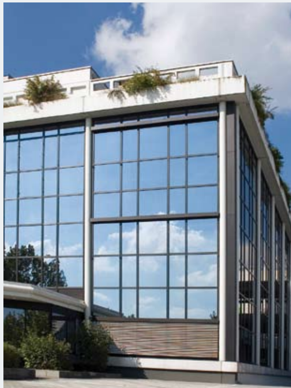
Pegasus Business Center, München